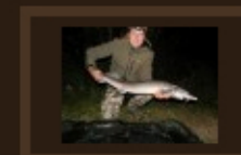
Jezero Velká Kopa